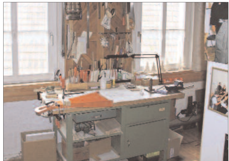
Zentrallabor für Forschung und Entwicklung.