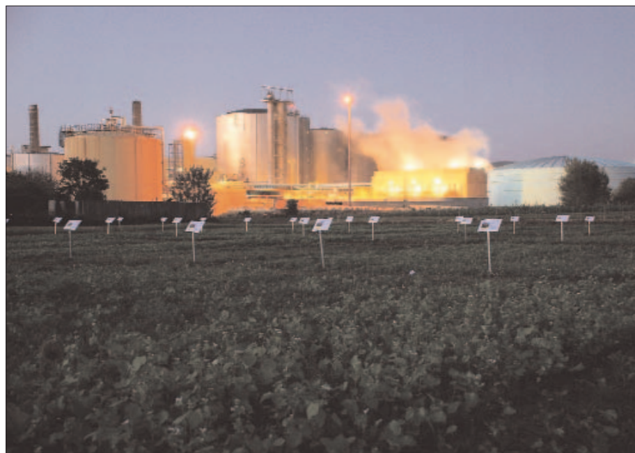
Kampagne im österreichischen Tulln.