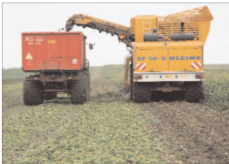
Rübenernte in Polen.