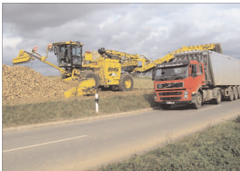
LKW statt Schlepper - Rübenverladung bei der LMG Ochsenfurt.

Die Kampagne begann am 24. September und wird voraussichtlich bis 17. Januar dauern. Die Rodebedingungen wurden durch eher trockene Verhältnisse im September und teils im Oktober erschwert, infolge von Niederschlägen vor allem in der zweiten Oktoberhälfte haben sich diese jedoch bedeutend verbessert. Über 50 % der Rüben werden per Bahn angeliefert. 24.000 t Bio-rüben und weitere 150.000 t österreichische Industrierüben wurden im tschechischen Werk Hrusovany verarbeitet. Auch das slowakische Werk Sered verarbeitet in diesem Jahr ca. 20.000 t Rüben aus Österreich.