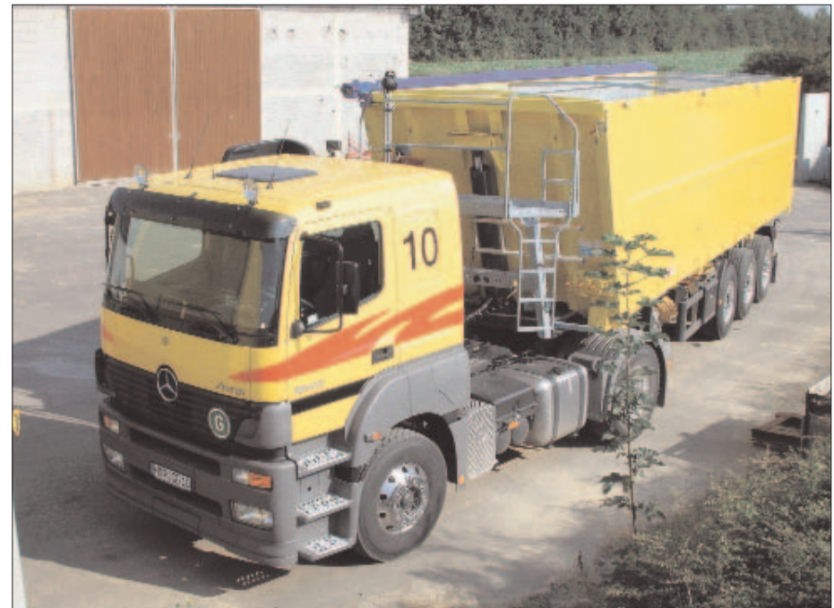
Mit Kornschieber und Plane lassen sich Sattelzüge auch außerhalb der Kampagne einsetzen. Die Befreiungstatbestände von den Sozialvorschriften sowie von der Grundqualifikation bzw. der Weiterbildung gelten nur, wenn das Ladegut ausschließlich für landwirtschaftliche Zwecke und nicht für einen Gewerbebetrieb wie Lagerhaus oder Biogasanlage transportiert wird.

Dies ist z.B. der Fall, wenn für eine gewerbliche Biogasanlage transpor-