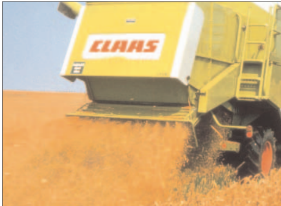
Exakte, gleichmäßige Verteilung des kurz gehäckselten Strohs über die gesamte Arbeitsbreite ist die Voraussetzung für ein gelungenes Strohmulch-Verfahren.

Der Gesetzgeber hat dieses im Rahmen der „Guten fachlichen Praxis“ verpflichtend festgelegt und wird zukünftig die Einhaltung auch innerhalb der Cross Compliance-Verordnung überwachen.