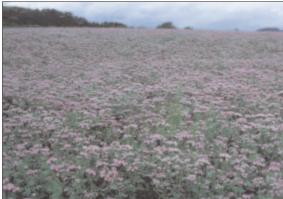
Ein blühender Phacelia-Bestand ist nicht nur ein „Farbtupfer“ in der Herbstlichen Feldflur und eine hervorragende Bienenweide. Die nach Winter abgefrorenen Stängel und offenen Wurzelröhren bieten einen optimalen Schutz vor Wassererosion.

Grundvoraussetzung für ein gelungenes Verfahren ist eine optimale Strohverteilung nach dem Mähdrusch. Je breiter das Schneidwerk und je grüner und feuchter das