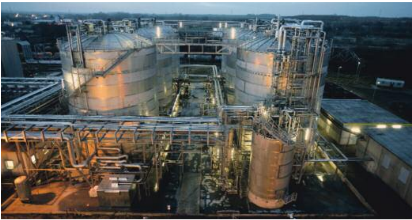
In Zeitz (Sachsen-Anhalt) produziert CropEnergies in der größten Bioethanol-Anlage Europas seit 2005 den Biokraftstoff Ethanol mit einer Produktionskapazität von 360.000 m 3 /Jahr.

struktur, Saatgut, Bildung, Finanzierung etc).