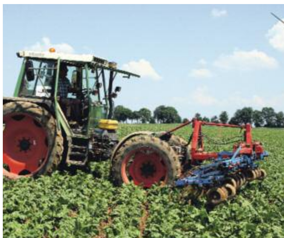
Bei verschlammten Böden kommt auch wieder mal die Hackmaschine aus dem Stall.