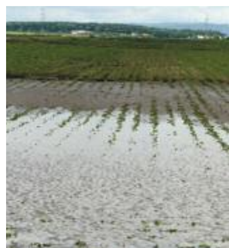
Bei den einen Trockenheit und den anderen „Land unter“ - auch das Rübenleben ist ungerecht!

Was gar nicht geht auf dem Rübenspielfeld, sind vergessene Schosser! Wohl dem, der noch ein bisschen Unkraut übrig gelassen hat und jetzt so wieso seine Frau zum Acker-Walking mit Handhacke überreden muss („hab Dir doch extra den fendt-grünen Turbo-XL-Bikini geschenkt!“...). Da kann man die Schosser auf dem Rückweg ja